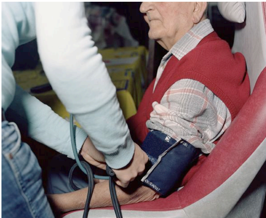
Les soins #19 – photographie couleur 79,3 x 95,3 cm – Ed 1/5 Extrait de la série « COSI ou les interdépendances humaines » - 2007

Extrait du texte de Caroline Bach sur « Le cycle du travail »