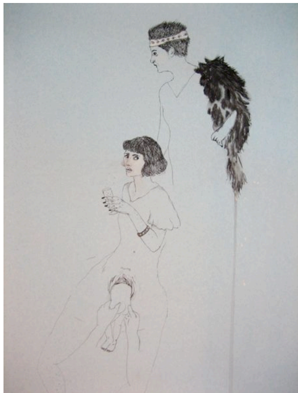
Détail, sans titre - 2007 90x90cm - Encre de chine et vernis sur papier