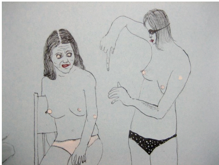
Détail, sans titre - 2007 90x90cm - encre de chine, vernis et collage sur papier