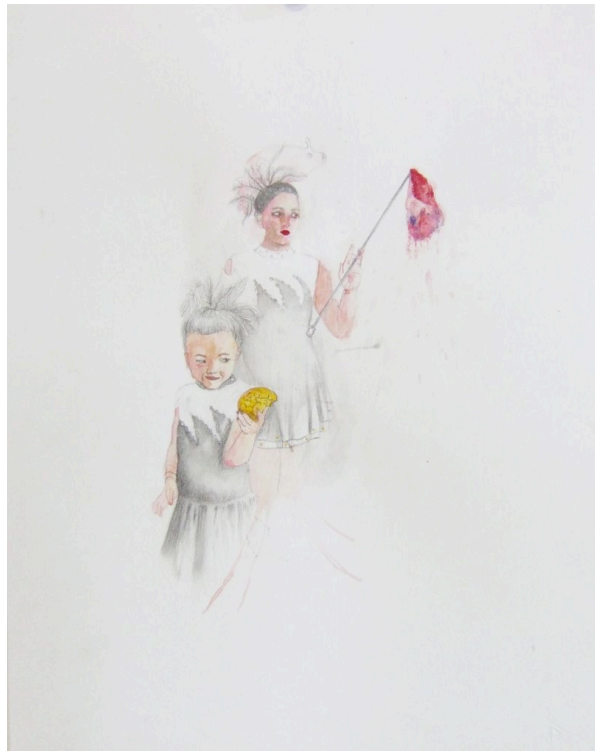
sans titre 2007 - 25x32,5cm - aquarelle et crayons sur papier