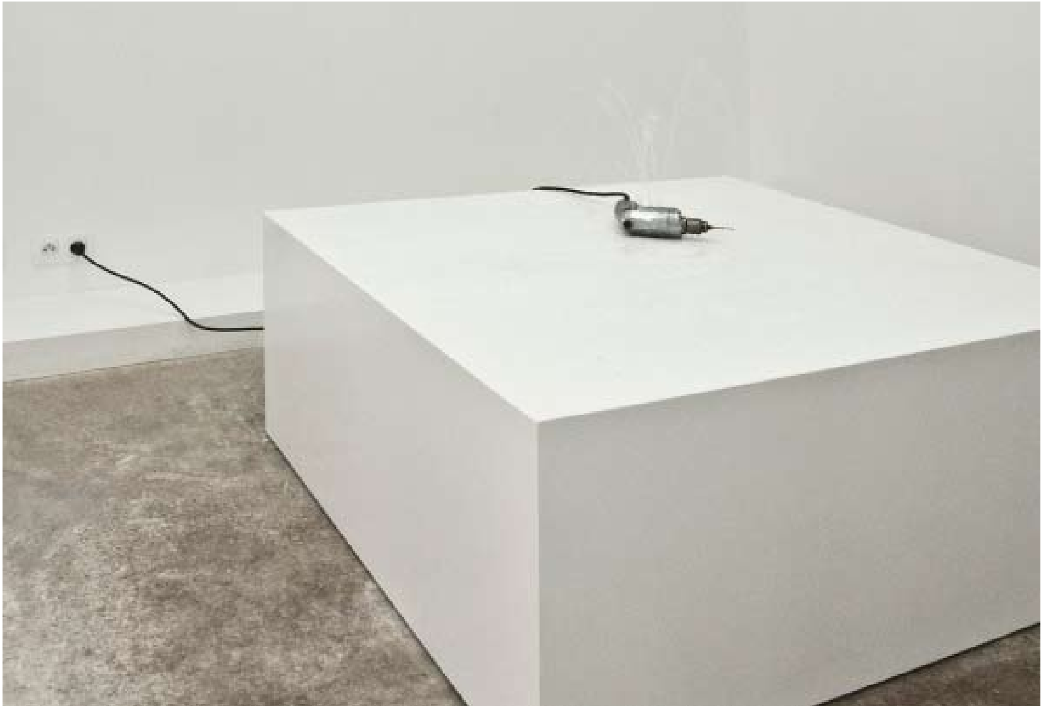
Michel de Broin, Bleed , 2009, Perceuse électrique, pompe , 120 x 120 x 50 cm, pièce unique