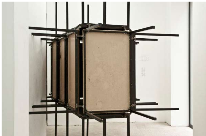
Michel de Broin, Shelter , 36 tables, système de fixation, 2009

La galerie Le Cabinet présente Michel de Broin. Sculpture, installation et vidéo ont été réunies autour d'une dialectique de la confrontation, de la contrainte. Une perceuse fuit, comme auto-mutilée, l'eau jaillit sans discontinuer. Il faut contourner l'épineuse sculpture de tables de cafétéria pour accéder au sous-sol, puis encore prendre garde aux pieds qui ont traversé le mur pour enfin découvrir une vidéo en boucle au son saturé dans laquelle une voiture et un camion se font face à vive allure sur une route sans fin.