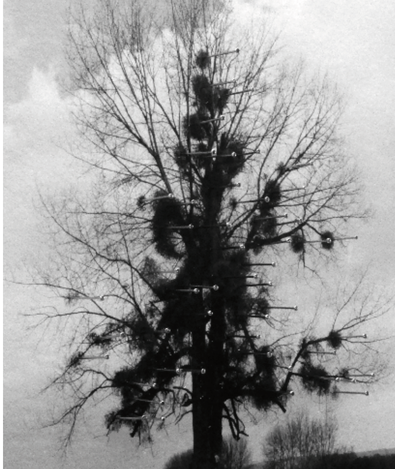
Isabelle GIOVACCHINI, Parasite , boîte entomologique, tirage Piezo au charbon, épingles, 40 x 50 x 5,5