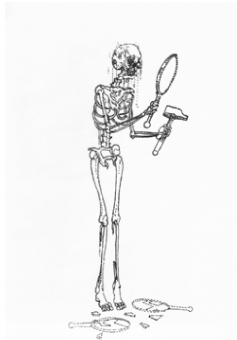
Thierry AGNONE, Sans titre , rotting sur papier calque, A3, 2010