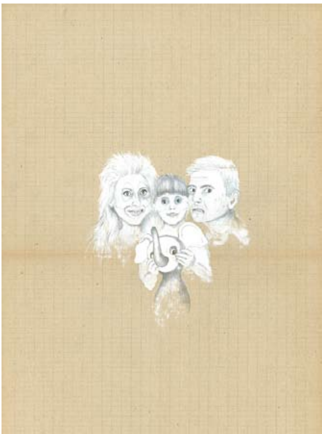
Sans titre , 2008. 27 x 41,5cm, Crayon gris et vernis sur papier ancien. Collection privée