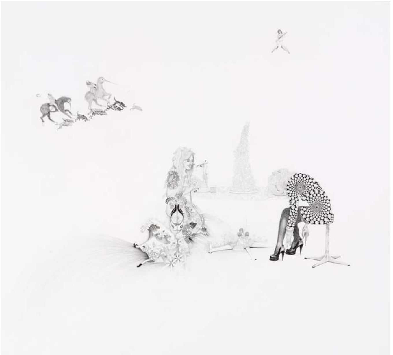
Sans titre , 2008, 120 x 115 cm, crayon gris sur papier