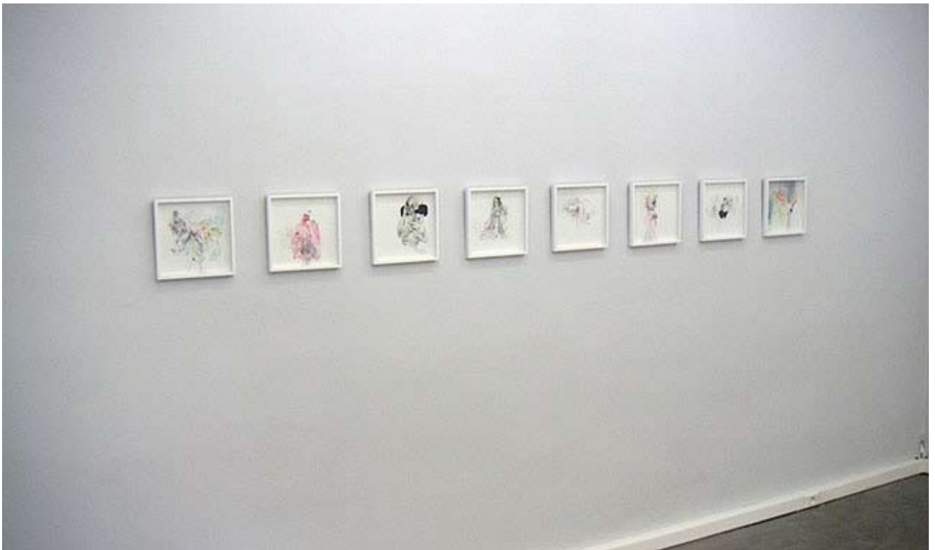
Vue de l'exposition LICK THE RAINBOW, Galerie Espace A VENDRE, mars 2006