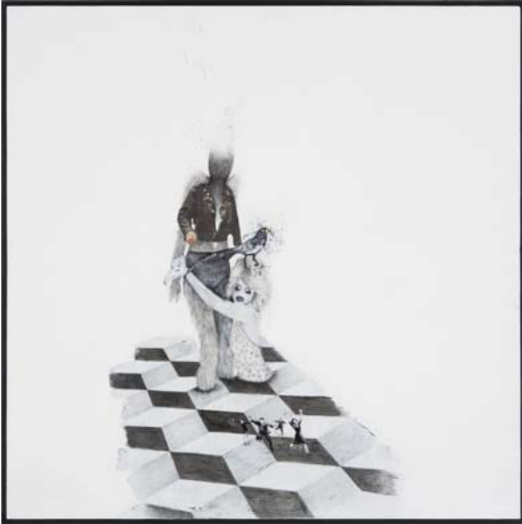
Sans titre , 2008, 32 x 32 cm, peinture, crayon vernis et collage sur bois (détail)