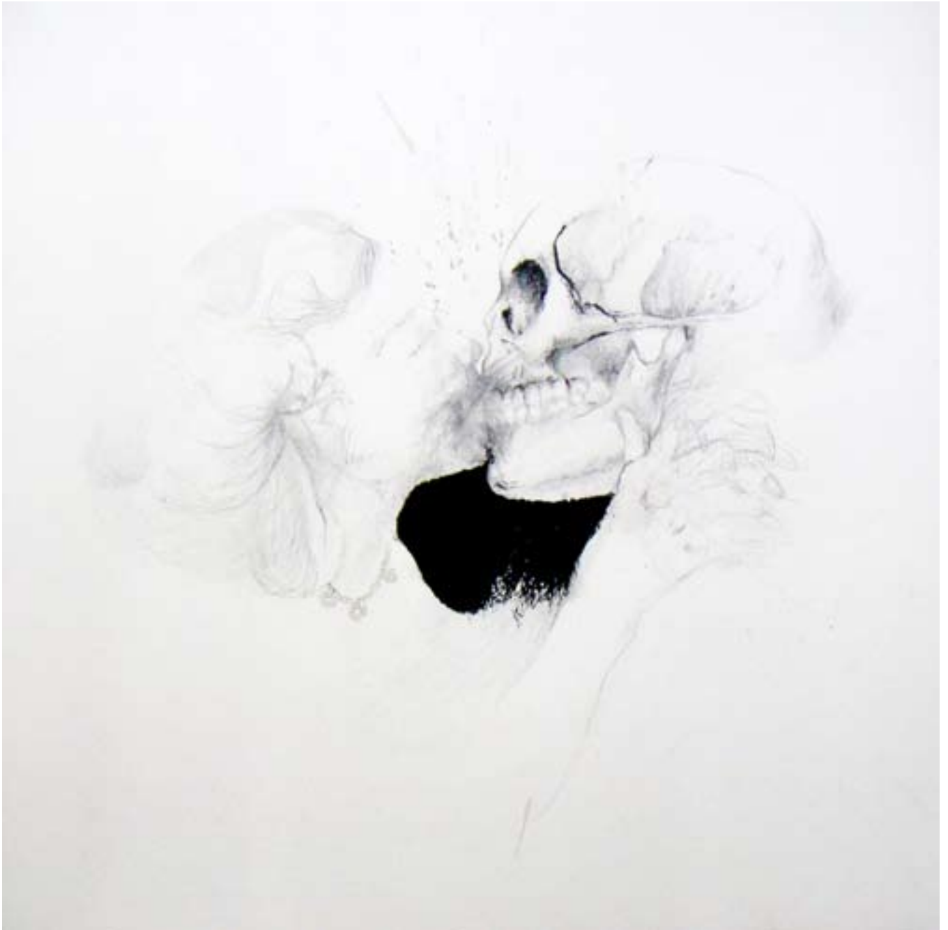
Série Accélération de l'index, Sans titre, 2006, 24,5 x 24,5 cm, encre et crayon sur papier. collection privée