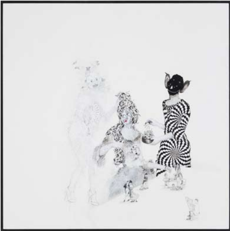
Sans titre , 2008, 32 x 32 cm, peinture, crayon vernis et collage sur bois (détail)