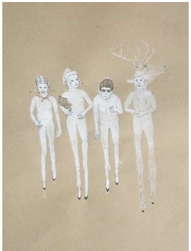
Le vrai carnaval , 2008. 49 x 32 cm, crayon gris et vernis sur papier ancien